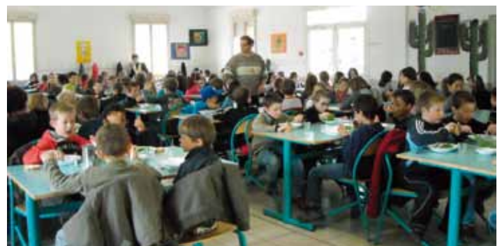
Des repas à thèmes sont prévus tous les ans : Noël, Pâques, Américain...